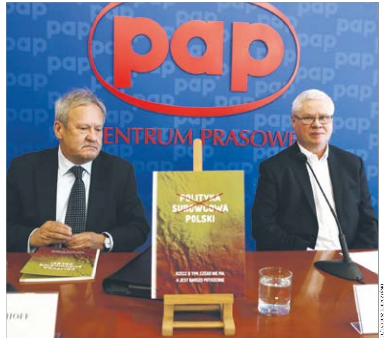
Współautorzy raportu od lewej: dr inż. Janusz Steinhoff i prof. dr hab. Jerzy Hausner, podczas konferencji prasowej w Warszawie – 10.03.2015 r.

Krytycznie należy ocenić to, że Polska – kraj zasobny w cenne surowce mineralne – nie ma strategii gospodarowania surowcami mineralnymi, a zwłaszcza skutecznej ochrony udokumentowanych, lecz niezagospodarowanych złóż.